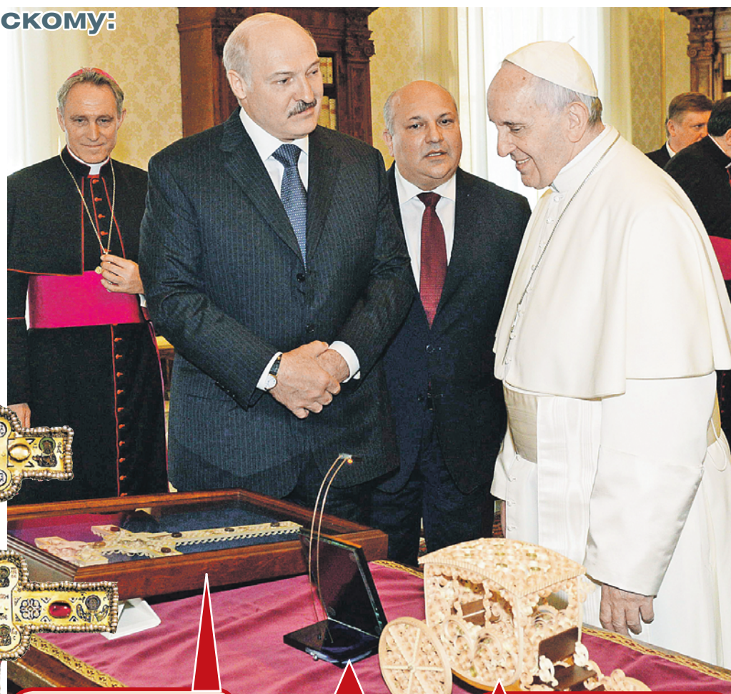
Президент преподнес в дар Папе копию креста Евфросинии Полоцкой.

Президент Беларуси сделал подарок Папе (см. на фото). Франциск в ответ вручил три собственноручно написанных документа о Евангелии, охране природы и семье. Лукашенко пообещал прочесть их и передать в президентскую библиотеку. Еще один презент понтифик передал со словами: «Минск может быть местом мира». Это был рисунок оливкового дерева - символа мира.