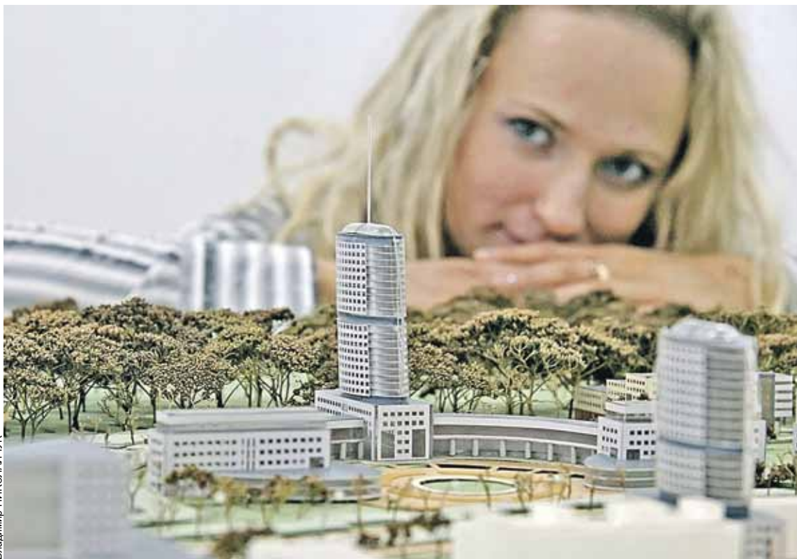
Так в будущем будет выглядеть минский технопарк.

Созданный в сентябре 2005 года декретом Президента Республики Беларусь, Парк высоких технологий (ПВТ) уже