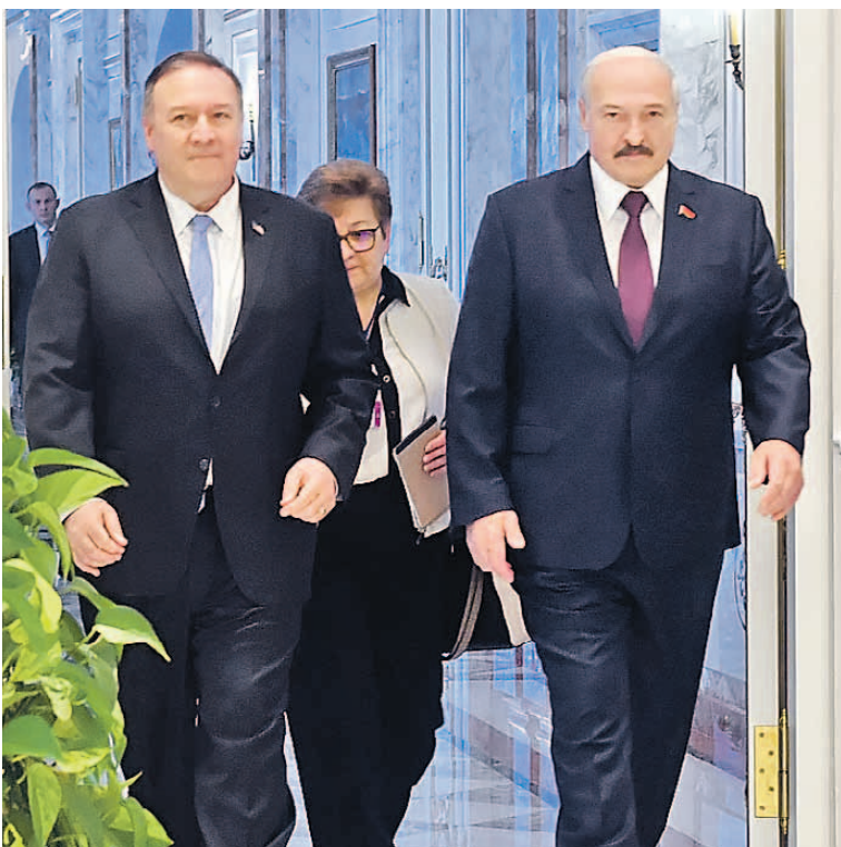
После визита Майкла Помпео (на фото) Александр Лукашенко высказался об отношениях с Америкой: «Период холода, когда мы смотрели друг на друга через амбразуру, закончился».

О том, как РФ и РБ противостоят угрозе коронавируса - на стр. 3.