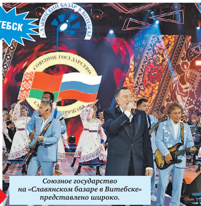
Союзное государство на «Славянском базаре в Витебске» представлено широко.