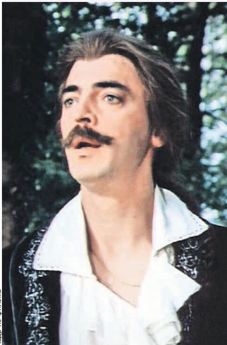
Поэт Боярский «ланфрен-ланфра», а оказывается, это «ай-люли-люли».

Но мы же не спрашиваем, например, что значит «ай-люли-люли». Это необъяснимо, - разводит он руками.