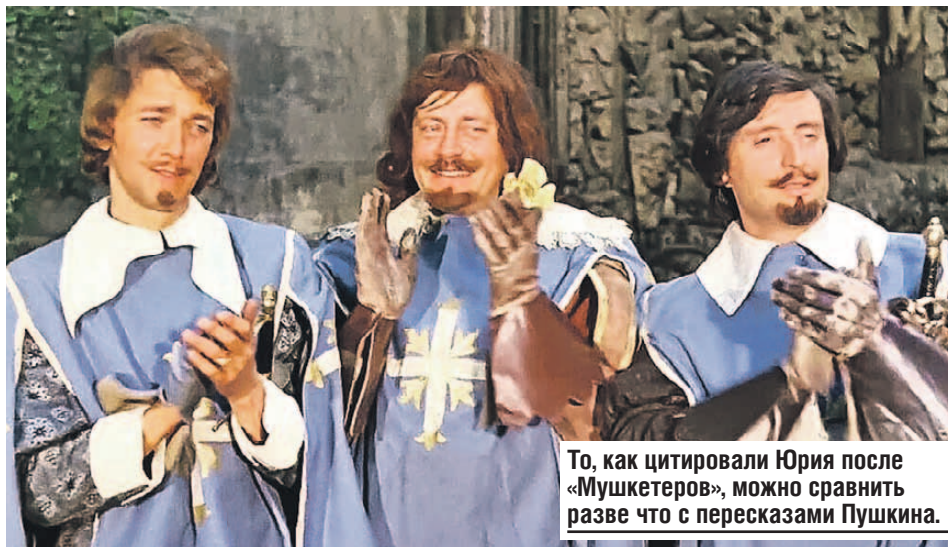
То, как цитировали Юрия после «Мушкетеров», можно сравнить разве что с пересказами Пушкина.