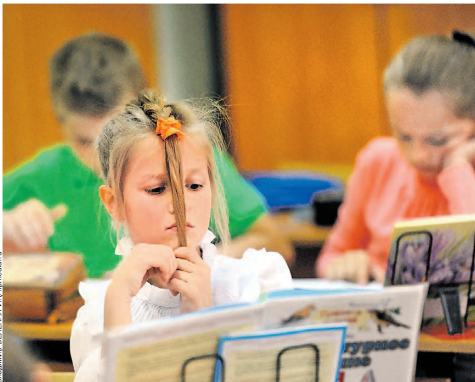
Когда у тебя шестой урок подряд, волосы не то что дыбом становятся - вокруг головы заплетаются.

- Слышал предложения вернуть в программу классическое черчение, хотя сейчас никто уже так не чертит, да и предмет этот нужен не всем, - рассказывает Ефим Рачевский, директор центра образования №548 «Царицыно» в Москве. - Существует наивное представление, что сто-