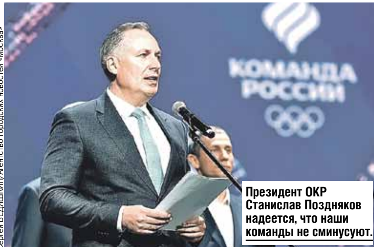
Президент ОКР Станислав Поздняков надеется, что наши команды не сминуют.

Намек на откат впервые прозвучал в конце декабря в швейцарской Лозанне, где проходил исполком МОК. «Главный олимпиец» планеты Томас Бах опять рекомендовал продлить отстранение России и Беларуси, но сделал ряд очень интересных заявлений. Главное, раскрыл детали своей беседы с Эммануэлем Макроном. Так вот, Президент Франции, если верить словам Баха, призвал его допустить до участия в парижской Олимпиаде абсолютно все страны, несмотря на политическую ситуацию. Намек на Россию и Беларусь совершенно очевиден. К тому же Макрон давно рвется примерить на себя роль глобального миротворца. И Олимпийские игры