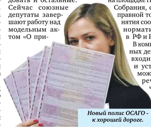
Новый полис ОСАГО - к хорошей дороге.

Первая ласточка взлетела, теперь за ней должны последовать и остальные. Сейчас союзные депутаты завершают работу над модельным актом «О при-