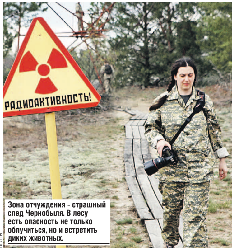
Зона отчуждения - страшный след Чернобыля. В лесу есть опасность не только облучиться, но и встретить диких животных.

Для примера, в Беларуси вопросы преодоления по-