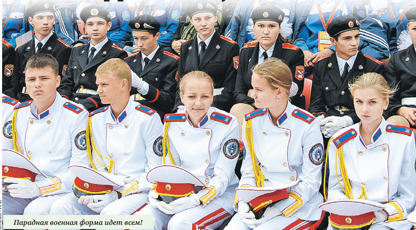
Парадная военная форма идет всем!