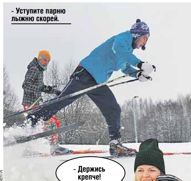
- Держись крепче!

Всего в двадцати километрах от Минска находится легендарный Республиканский центр олимпийской подготовки по зимним видам спорта «Раубичи». Зимой на трассе раздолье для поклонников беговых лыж. А еще здесь располагается склон для сноуборда, а также лыжные трамплины. Сюда часто приезжают профи, чтобы прокатиться по крутому лыжному спуску или продемонстрировать ловкость на акробатическом склоне, на котором проводились этапы Кубка Европы по фристайлу. В «Раубичах» организуют самые заметные спортивные турниры, где болельщики тепло поддерживают всех без исключения, но громче всего, белорусов и россиян.