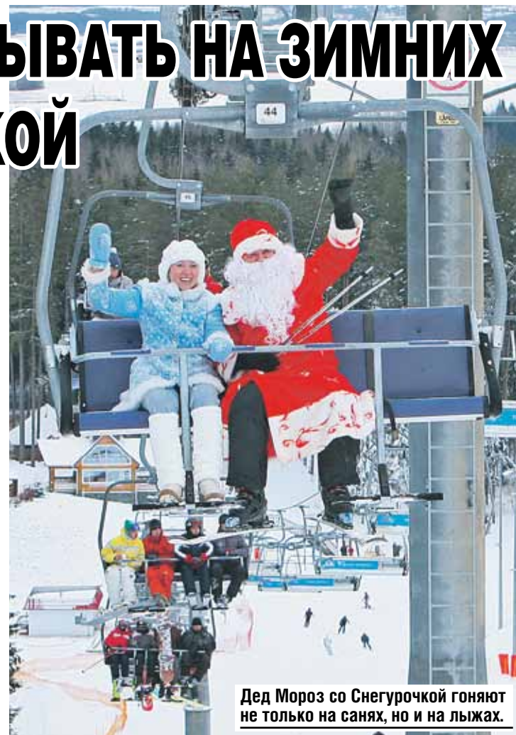
Дед Мороз со Снегурочкой гоняют не только на санях, но и на лыжах.

«Силичи» - это не только про катание. Для тех, кто устал от бешеного ритма жизни, тревожится по пустякам или близок к профессиональному выгоранию, создали программу «Антистресс». В недельном релакс-туре - дыхательная гимнастика, массаж, спа, галотерапия, правильное питание. Да и сама природа здесь врачует не хуже различных процедур.