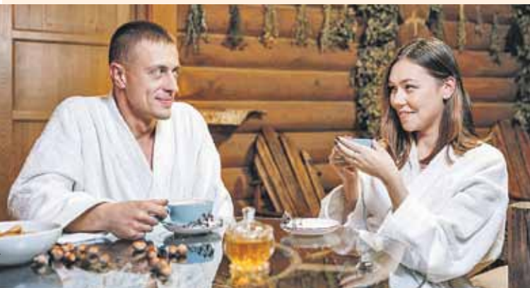
Что для счастья надо? Хорошо попариться в бане.

И обязательно загляните в местный ресторанчик. Перед домашним салом, кабачковой икрой, драниками с мачанкой, ароматным горшочком с курицей и грибами устоять невозможно. А еще фишка горнолыжного комплекса - традиционная дровяная баня.