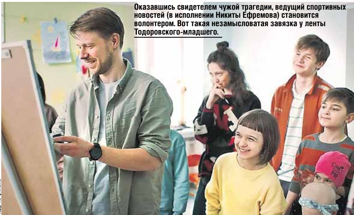
Оказавшись свидетелем чужой трагедии, ведущий спортивных новостей (в исполнении Никиты Ефремова) становится волонтером. Вот такая незамысловатая завязка у ленты Тодоровского-младшего.