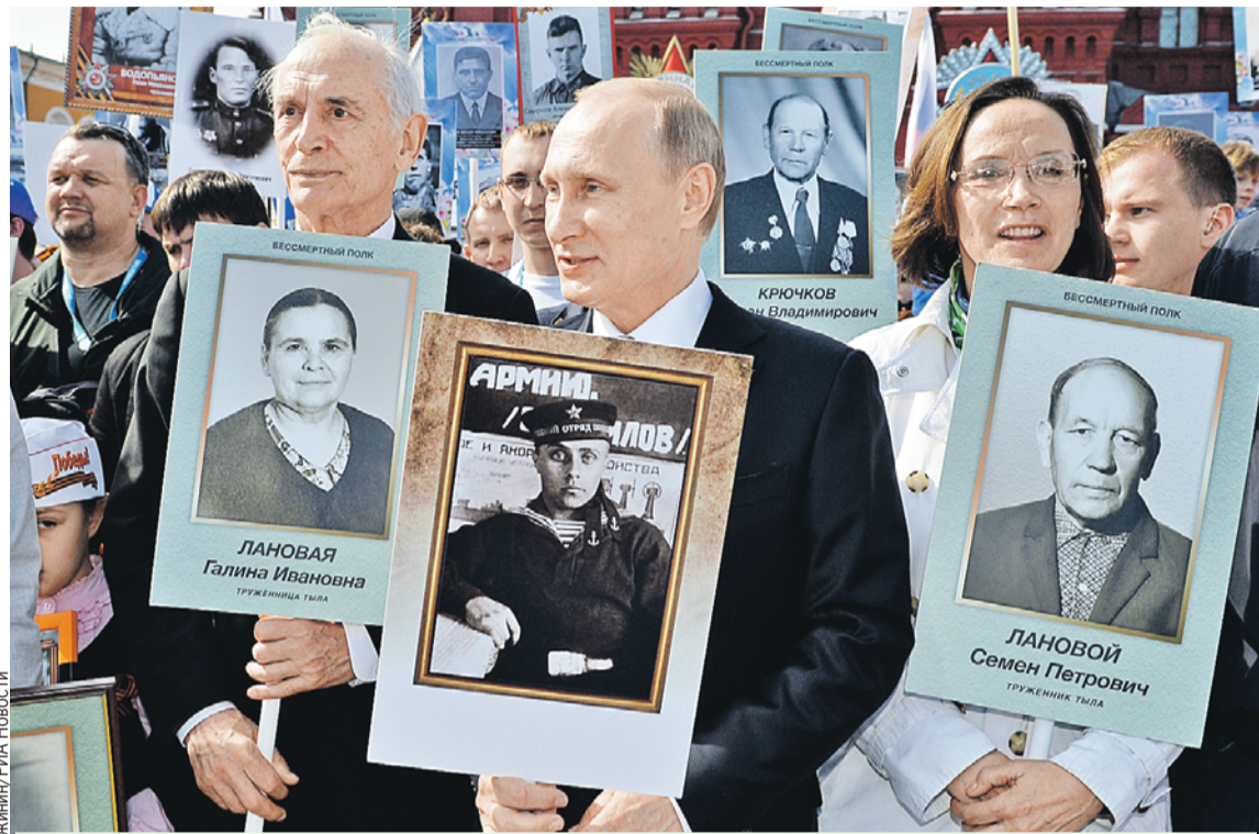
Василий Лановой и его супруга Ирина Купченко - неизменные участники ежегодной акции. В прошлом году к колонне «Бессмертного полка» присоединился Президент России Владимир Путин.

ели яблоки, кукурузу, тыкали пальцами в нашу сторону и хохотали. Еще они играли на губных гармошках. У колодца устроили настоящее шоу - разделись догола на виду у всех и стали обливаться водой. Вели себя нагло, как завоеватели.