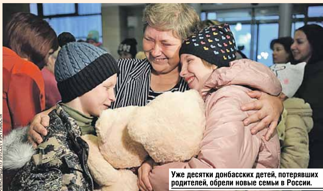
Уже десятки донбасских детей, потерявших родителей, обрели новые семьи в России.

- А одна маленькая девочка залезла ко мне на колени и на ушко шепчет: «Нас в этот дом, наверное, не возьмут». «Малыш, почему?» - спрашиваю я. «А потому что