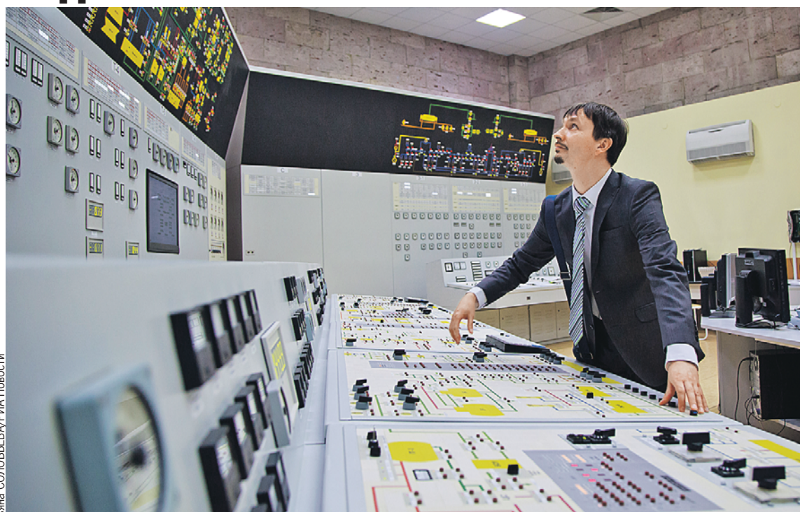
На тренажере Нововоронежской АЭС белорусские атомщики отработают и ежедневные процедуры, и нештатные ситуации.

В прошлом году здесь уже прошли обучение 72 сотрудника БелАЭС.