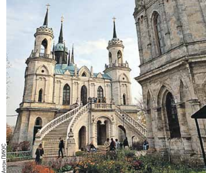
Храм Владимирской иконы Божией Матери будто строили для сказки про Золушку.