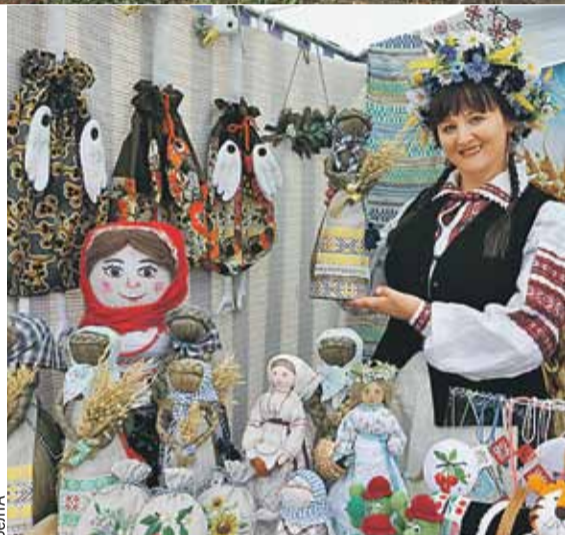
Для благополучия в доме и везения в личной жизни - льняные обереги!

В России - гжельский фарфор, жостовские подносы, палехские шкатулки и хохломская посуда. А чем могут похвастаться белорусы? Маляванки, вышитые сорочки, расписная мебель, тканые покрывала и рушники - чего только не продают народные умельцы! Традиционным промыслам государство оказывает существенную поддержку - культурное наследие не должно исчезнуть в эпоху массового потребления. Бойкая торговля хенд-мейдом проходит именно на сезонных фестивалях.