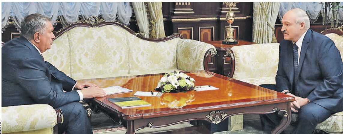
Руководитель «Роснефти» Игорь Сечин приехал в Минск по приглашению Александра Лукашенко, чтобы решить острые вопросы в сфере энергетики. Диалог, по мнению обеих сторон, был конструктивным.

С нефтяного вопроса началась и встреча с губернатором Архангельской области Игорем Орловым. Глава государства извинился за небольшое опоздание, сославшись на телефонный разговор с Владимиром Путиным: