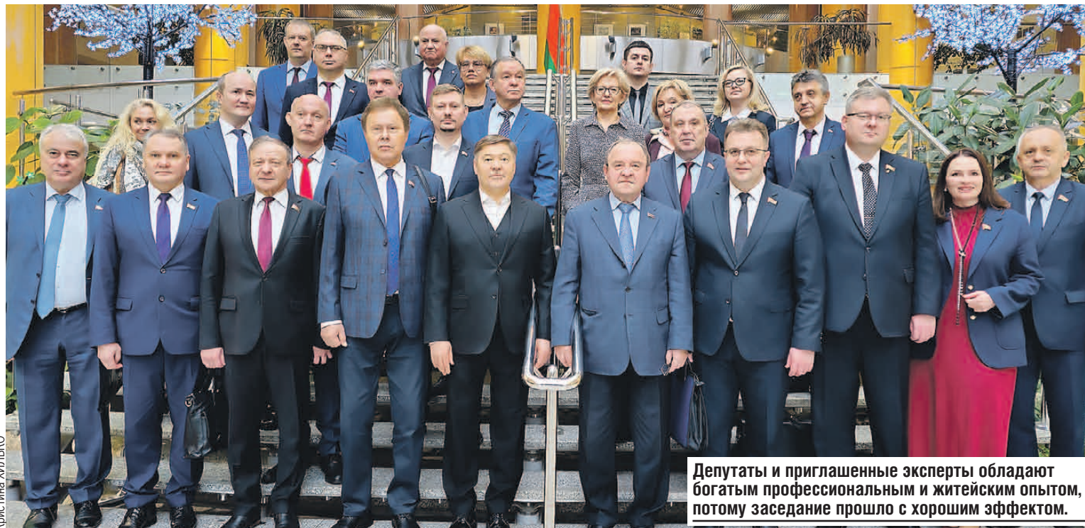
Депутаты и приглашенные эксперты обладают богатым профессиональным и житейским опытом, потому заседание прошло с хорошим эффектом.

- Хотелось бы, чтобы к моменту утверждения бюджета Парламентским Собранием