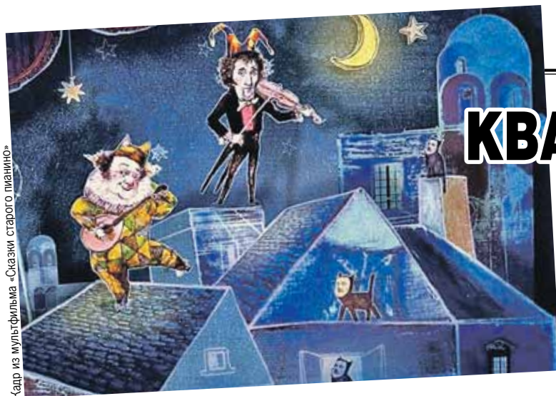
Кадр из мультфильма «Сказки старого пианино»