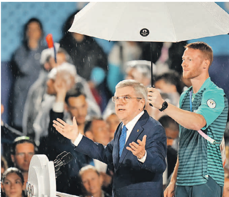
Каким бы зонтиком Бах ни прикрывался, от той гадости, в которую он окунул олимпийское движение, ему не спрятаться.

А его трансгендерные «шалости», когда мужики, по сути, крушили носы девушкам на олимпийском ринге в Париже, грозили уничтожить женский спорт как таковой. За эти половые эксперименты Баху, не исключено, придется