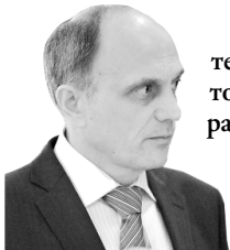
Заместитель директора Федеральной миграционной службы России