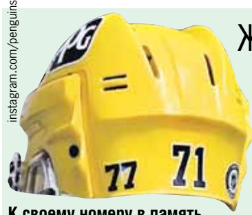
К своему номеру в память о Тимуре Евгений Малкин наклеил на шлем две семерки.

чтобы создать себе хоть какую-то подушку очковой безопасности. Поскольку дальше нас ждут игры с хорватами, которых считают, и по делу, главными фаворитами в нашей отборочной группе. Сыграть с ними вничью уже будет за счастье.