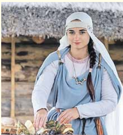
В археологическом музее покажут живую историю - древлянки сплут и приготовят традиционный обед.

Кроме того, пуща - рай, как ни странно, для охотников. Ловить разрешается, в частности, зайцев, куниц, норок, хорьков.