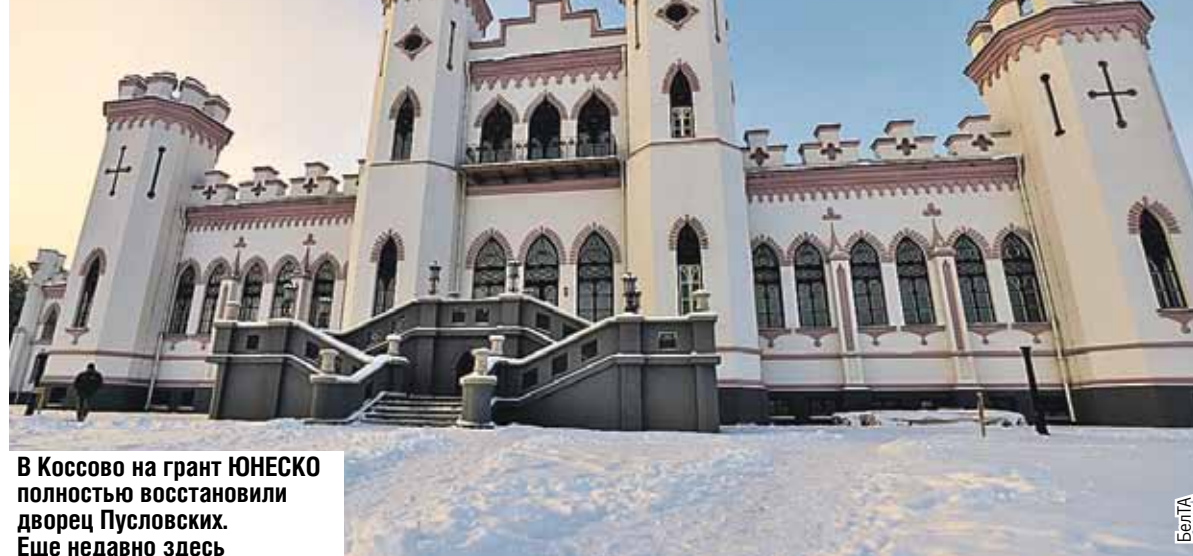
В Коссово на грант ЮНЕСКО полностью восстановили дворец Пусловских. Еще недавно здесь были только руины.

военно-патриотический туризм. Гости стали чаще посещать мемориалы, работают волонтерские лагеря и клубы исторической реконструкции.