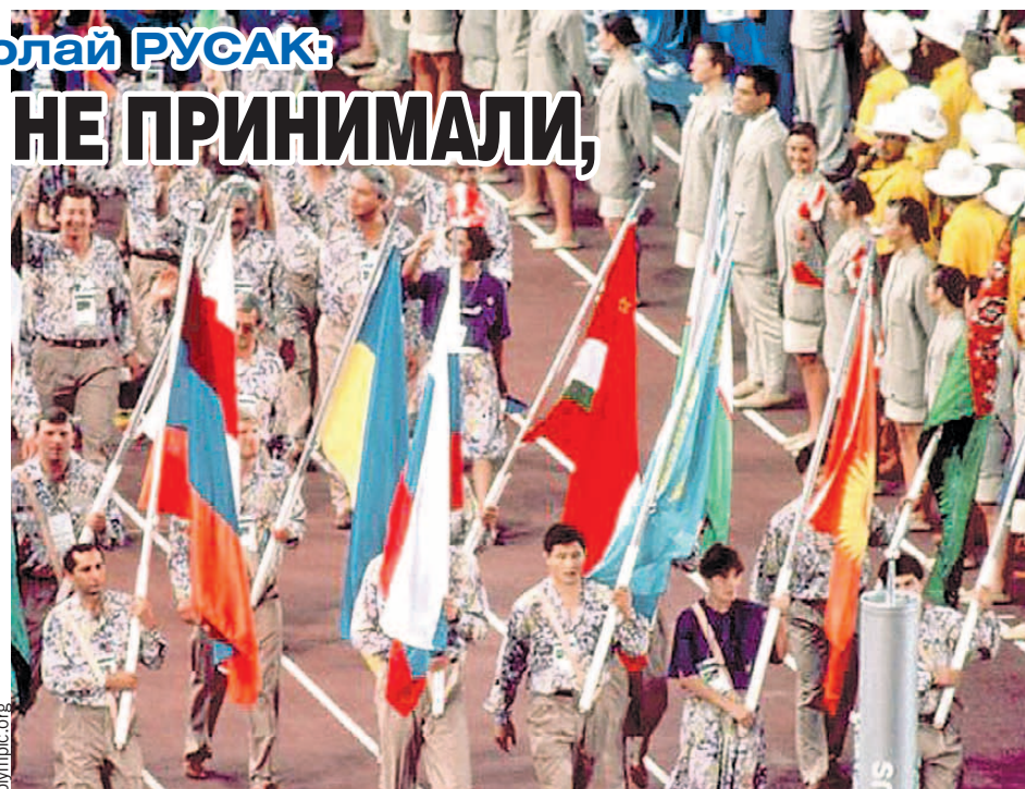
Команда в Барселоне-92 по-прежнему оставалась единой, но многие спортсмены вышли на церемонию открытия Игр с флагами своих национальных республик.

- Сейчас, к сожалению, кроме синхронного плавания и художественной гимнастики, традиции потеряны. Поэтому в других дисциплинах нет стабильных побед на крупных турнирах. Примерно то же самое произошло