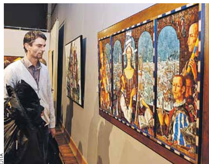
Жизнь, как и театр, прекрасна и удивительна, говорят герои полотен известного белорусского художника.