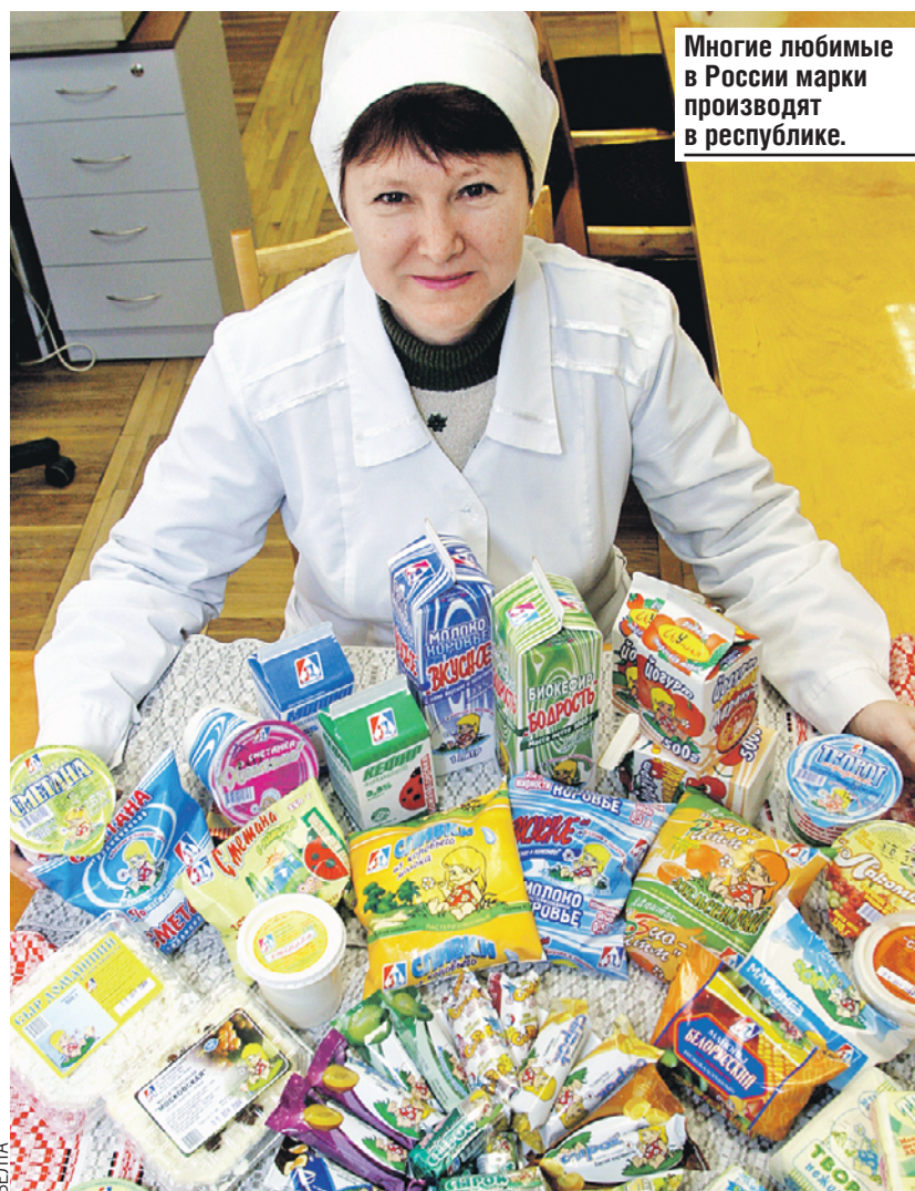
Многие любимые в России марки производят в республике.