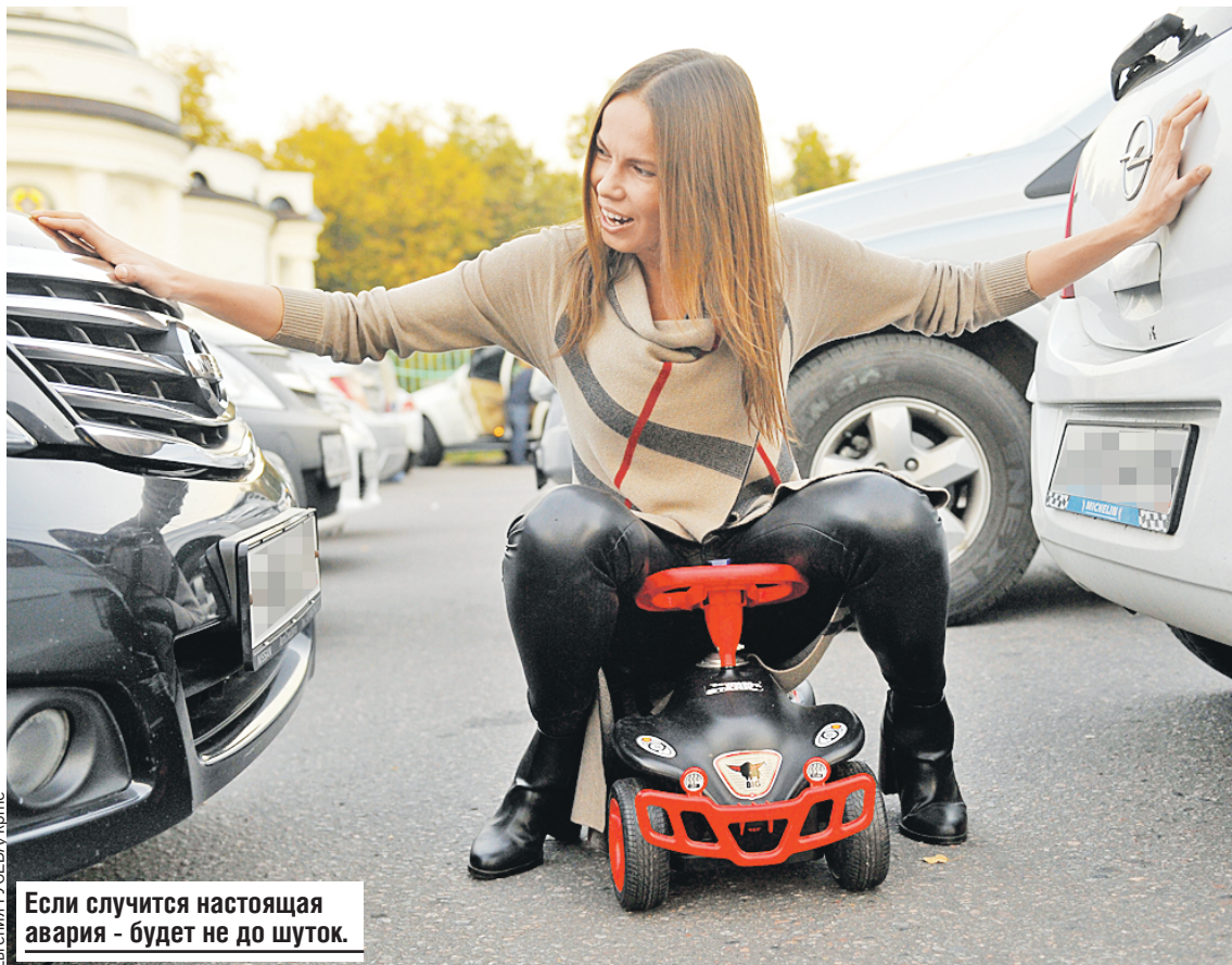
Если случится настоящая авария - будет не до шуток.

Большой плюс этого вида страхования, что лимит на компенсационные выплаты не установлен. «Потолок» для страхового возмещения ущерба - реальная стоимость ремонта или авто, если он не подлежит восстановлению.