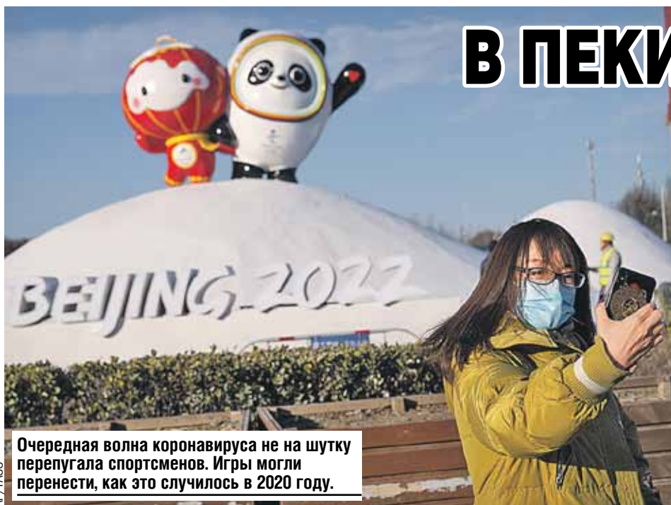
Очередная волна коронавируса не на шутку перепугала спортсменов. Игры могли перенести, как это случилось в 2020 году.