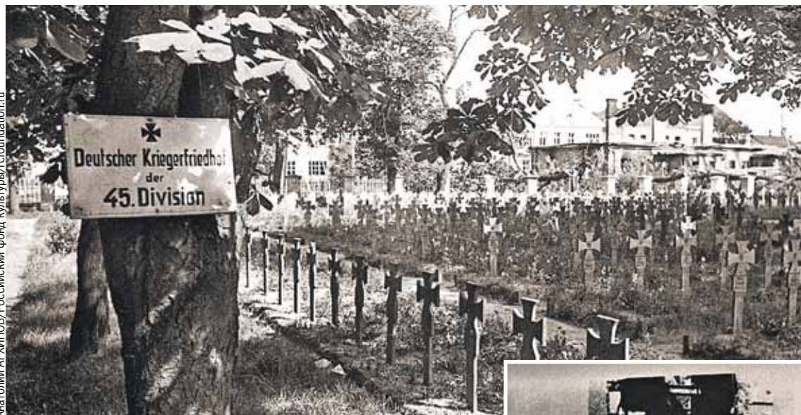
Это могилы немцев 1941 года. Оставшиеся в живых, стоя у Тереспольских ворот, поняли, что в СССР им не светит увеселительная прогулка. И где-то уже вытачивается такой березовый крест для кого-то из них.

Плотные разрывы снарядов сметали все и вся. Многие из тех, кто был на плацу, сразу погибли. Внезапность нападения позволила гитлеровцам с ходу ворваться в крепость. Но ворвавшись, они замешкались, решая, что делать дальше. В этот момент неизвестные герои выкатили из Восточного форта зенитную установку и в упор начали