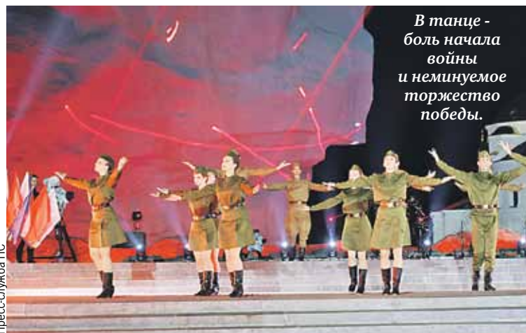
В танце - боль начала войны и неминуемое торжество победы.