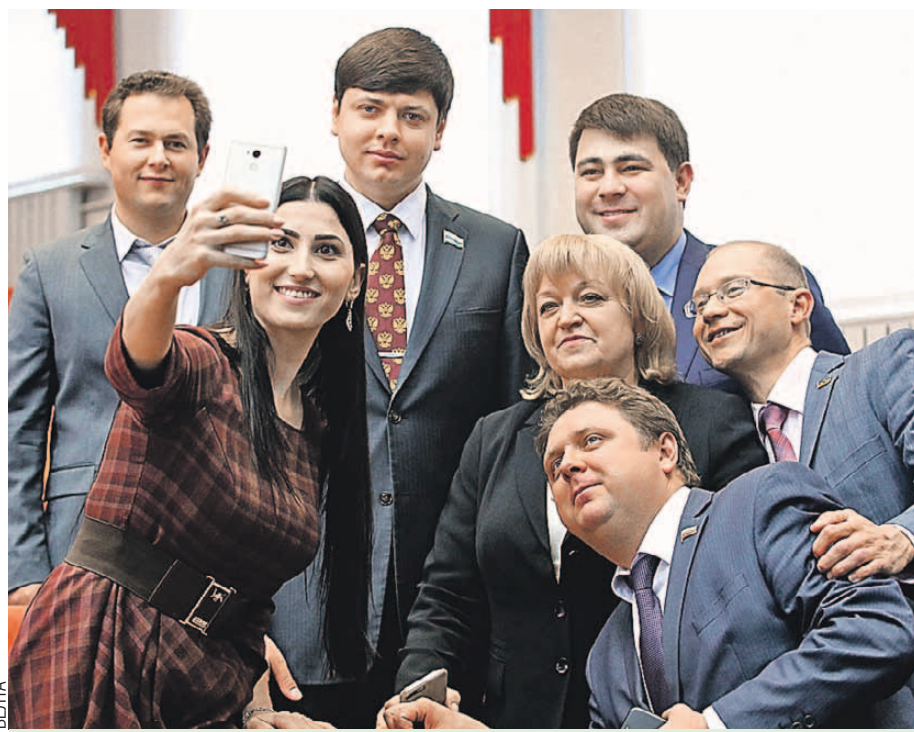
После официальной части - обязательное селфи на память.

впервые, - уточнил он. - Неравнодушных парней и девушек наших стран волнуют вопросы экономического развития, образования, здравоохранения, экологии. Будущее строить молодым. Активные, инициативные, умные должны сыграть ведущую роль в укреплении интеграции Союзного государства. Уверен, подписанные соглашения о региональном взаимодействии не останутся на бумаге, а придадут новый импульс развитию молодежного движения.