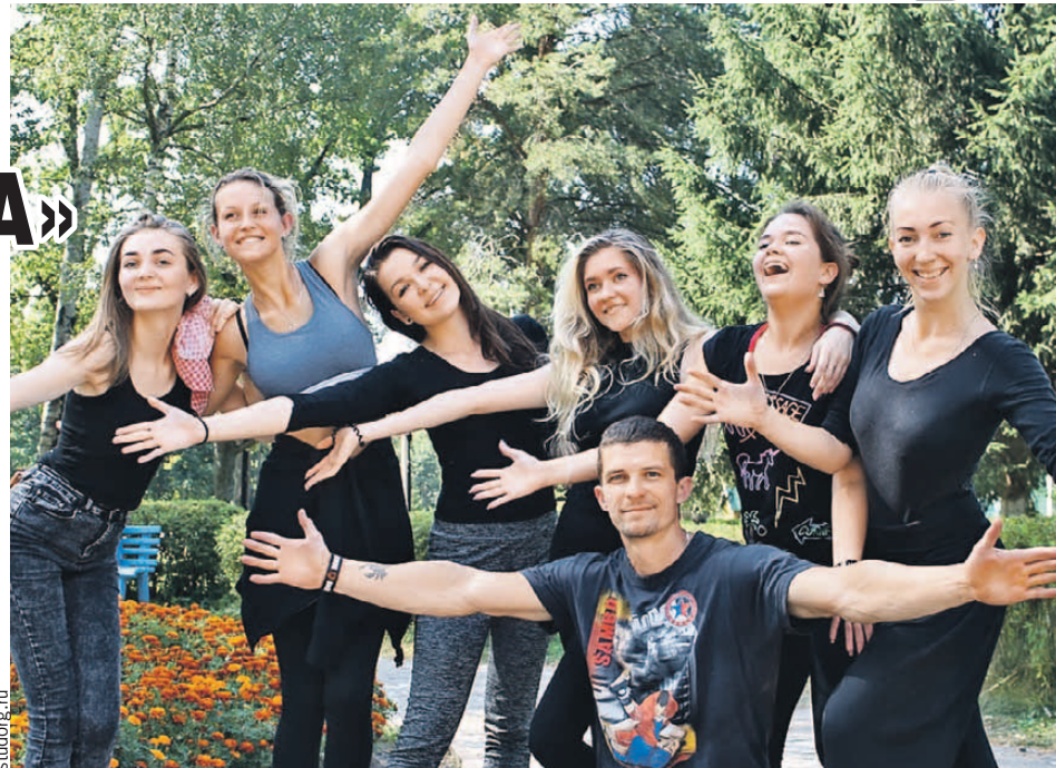
Юные, красивые и задорные! Парни и девушки наших стран открыты для свежих идей.

В прошлом году в Смоленске отметили десятилетие международного волонтерского лагеря «Надежда» на базе детского реабилитационного центра для инвалидов «Вишенки». Сюда приезжают волонтеры со всего мира, были даже трое англичан в возрасте за шестьдесят, которые помогают во всем: от игры на гитаре