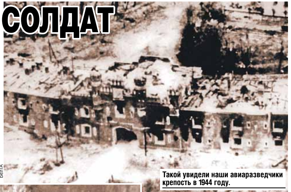
Такой увидели наши авиаразведчики крепость в 1944 году.

По подсчетам историков, на утро 22 июня в крепости находилось чуть больше трех тысяч советских бойцов. Многие из них погибли при первом артобстреле. Атака гитлеровцев застала гарнизон вра-