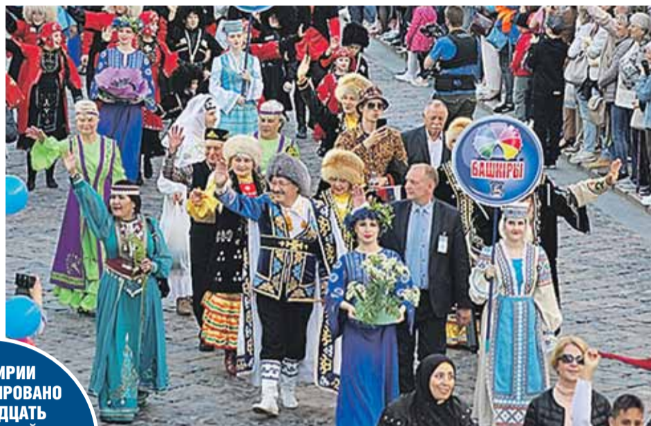
Дiaspora регулярно участвует в Фестивале национальных культур в Гродно.

В БАШКИРИИ ЗАРЕГИСТРИРОВАНО ЧЕТЫРНАДЦАТЬ ПРЕДПРИЯТИЙ, СОЗДАННЫХ ПРИ УЧАСТИИ БЕЛОРУССКОГО КАПИТАЛА.