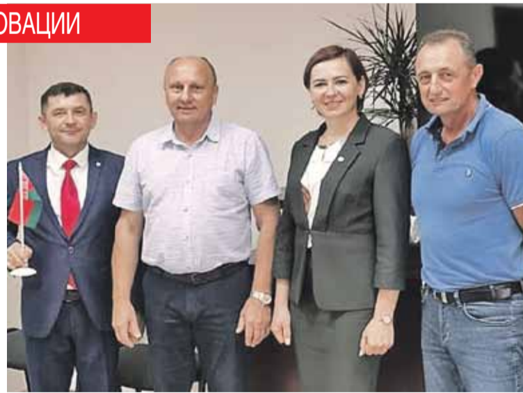
Предприниматели с удовольствием навещают Синеоку, где их ноу-хау оказалось востребованным.

Шел 2016 год. Проект российских предпринимателей оказался поначалу невостребованным. Система внедрения инноваций в российской «нефтянке» была не отлажена. Но изобретение нашло применение совершенно в другой отрасли - пищевой.