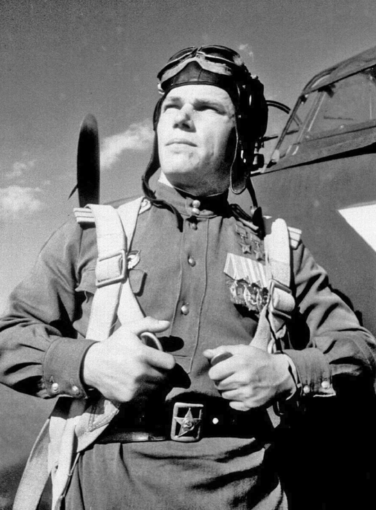
Иван Кожедуб перед боевым вылетом