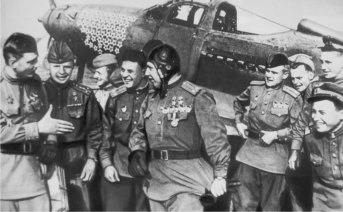
Александр Покрышкин (в центре) в кругу фронтовых друзей-летчиков

В Великую Отечественную войну ратные умельцы экстра-класса сражались в разных родах войск. Их называли асами.