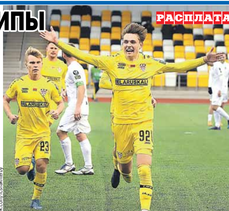
Рано радовались «горняки». Прошлогодняя победа «Шахтера» в первенстве РБ оказалась с душком.

Бронзовый призер минувшего первенства БАТЭ выступит в Лиге чемпионов, минское «Динамо» и «Ислочь» - в Лиге конференций. Третьим представителем в этом розыгрыше, скорее