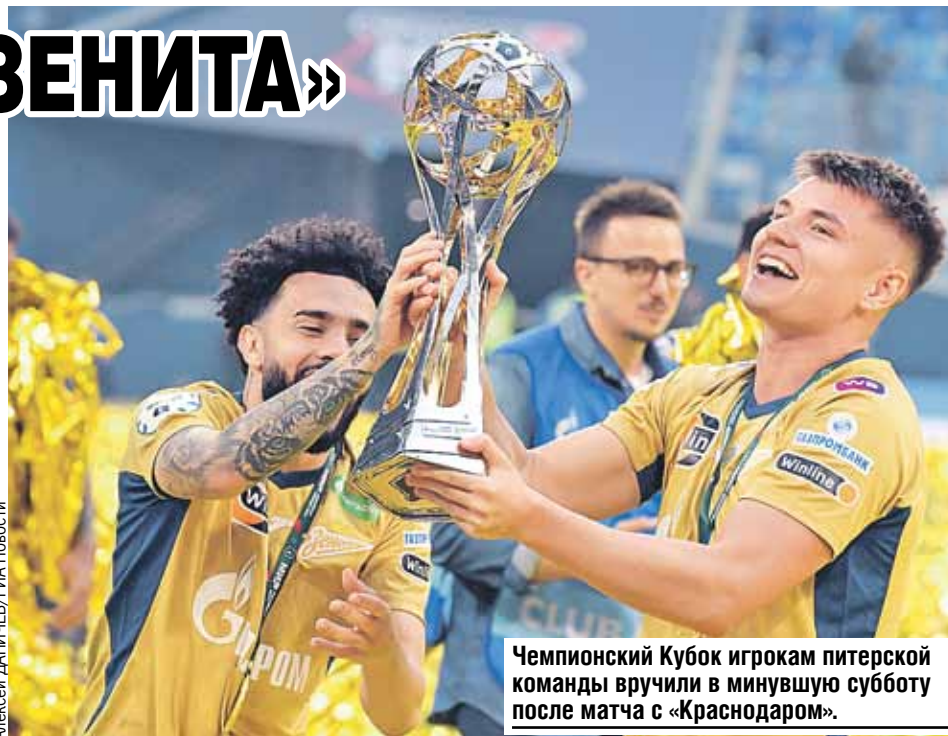
Чемпионский Кубок игрокам питерской команды вручили в минувшую субботу после матча с «Краснодаром».

Завистники между тем, как всегда, гундят. Мол, что стоил бы «Зенит» без спонсорской поддержки всемогущего «Газпрома», с такими деньжищами чемпионом может стать каждый. Не преувеличивайте, ребята. Деньгами еще надо уметь распорядиться с умом, а не выбрасывать их не пойми на что. «Спартак» тоже не бедствует за спиной другого гиганта - «Лукойла». Но с се-