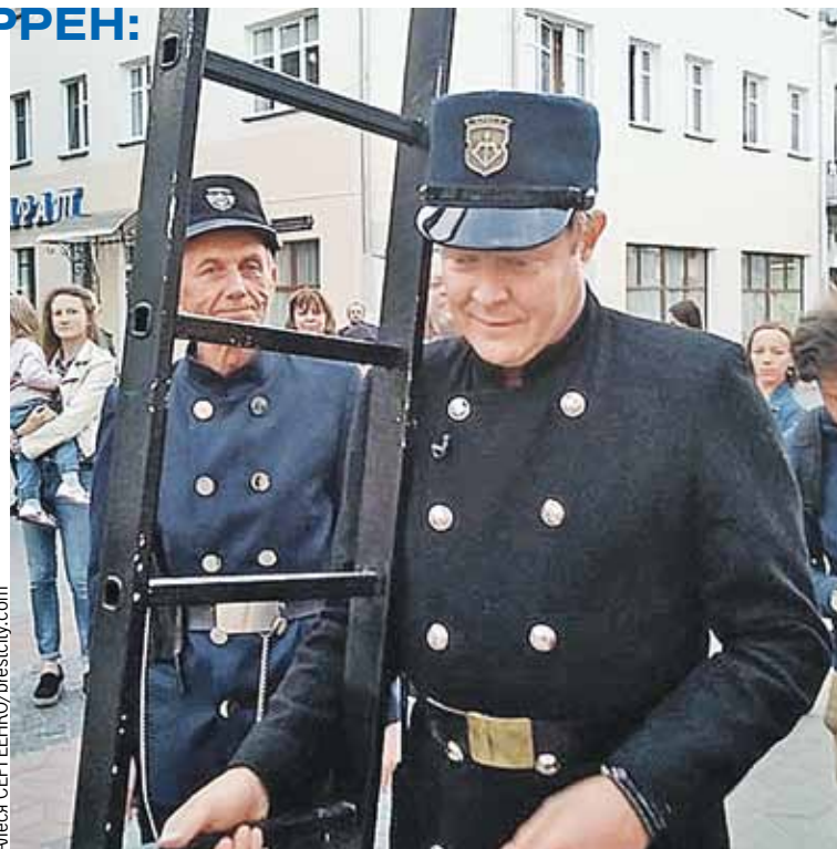
Джон Уоррен (справа) показал брестчанам, что один фонарщик - хорошо, а если он станет вторым - это будет супершоу.

Уоррен не раз называл Беларусь «краем самой вкусной картошки». Пару лет назад даже приезжал в Минск на знаменитый Комаровский рынок ради «бульбяного шопинга». Рыжему ведущему тогда несканно повезло: говор с английским акцентом растопил сердца белорусских продавщиц. Ему сделали неплохую скидку и надарили в прикуску