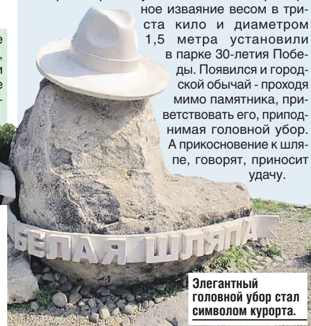
Элегантный головной убор стал символом курорта.

Второй вариант унести сложнее. Мраморное изваяние весом в триста кило и диаметром 1,5 метра установили в парке 30-летия Победы. Появился и городской обычай - проходя мимо памятника, приветствовать его, приподнимая головной убор. А прикосновение к шляпе, говорят, приносит удачу.