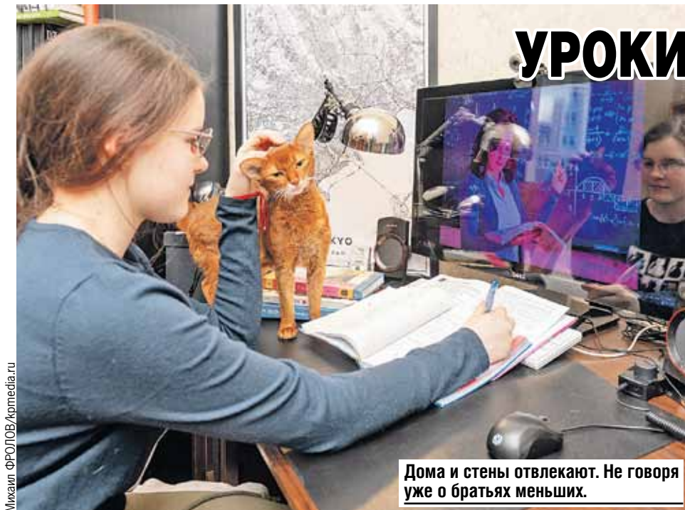
Дома и стены отвлекают. Не говоря уже о братьях меньших.