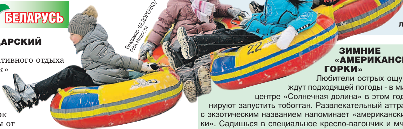
Поезд из ватрушек отправляется с третьего пути большого склона.

Новички осваивают азы катания под присмотром инструкторов на невысоком 11-метровом склоне. Для родителей с детьми работает тубинг-аттракцион «Веселая ватрушка». А экстремалы спешат в сноу-парк, где установлены фигуры для трюков, аэроподушка для тренировки прыжков с трамплина и есть сноуборд-кросс трасса.