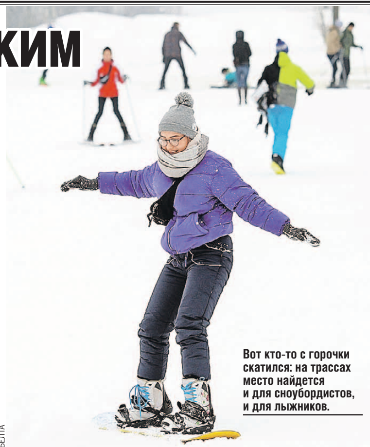
Вот кто-то с горочки скатился: на трассах место найдется и для сноубордистов, и для лыжников.

По соседству с «Логойском» находится еще один комплекс - «Силичи». Склоны здесь покруче, поупраж-