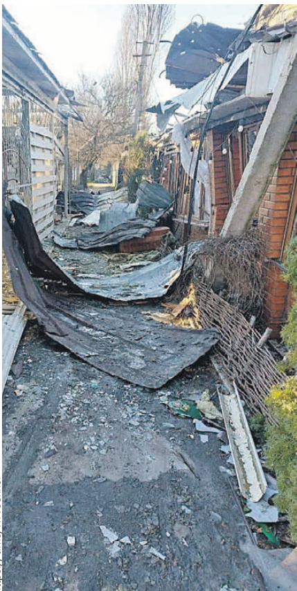
Все, что осталось от мирной гостиницы, которую растерзали безумные укронацисты.

Подсчитано, что шанс расстаться с жизнью у них - 92 процента. Это фактически смертники.