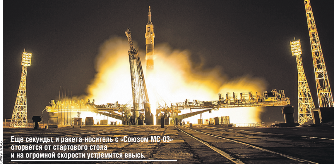
Еще секунды, и ракета-носитель с «Союзом МС-03» отрывается от стартового стола и на огромной скорости устремится ввысь.

с Байконура. На экране - ракета на стартовом столе. Команда «зажигание» и... тут же «пламень, гром, замер космодрома» - все, как в знаменитой песне про Гагарина.