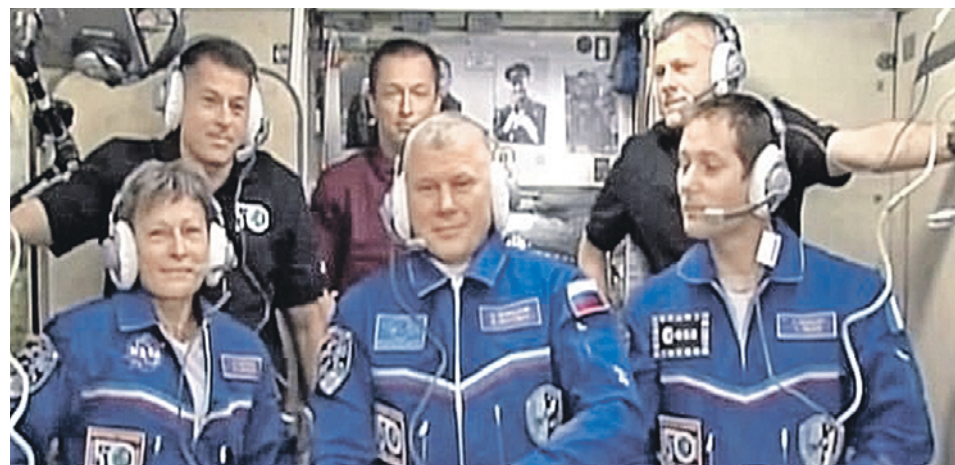
Пегги Уитсон, Олег Новицкого и Тома Песке (в синих костюмах) на борту МКС встретили звездные «аборигены» (слева направо) - американец Роберт Шейн Кимброу и россияне Сергей Рыжиков и Андрей Борисенко.

SOUZVECHE.RU ФОТОГАЛЕРЕЮ И ВИДЕОРЕПОРТАЖ ИЗ ЦУПА, А ТАКЖЕ ИНТЕРВЬЮ С БЕЛОРУССКИМИ КОСМОНАВТАМИ КЛИМУКОМ И КОВАЛЕНКОМ ЧИТАЙТЕ НА НАШЕМ САЙТЕ