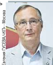
Евгения ГУСЕВА/«КП» - Москва

- Именно наша страна в эти сложные для всего человечества времена способна дать миру новую модель социально-экономического, духовно-нравственного государства, основанного на справедливости. Сегодня уже очевидно, что капиталистическая система выработала свой ресурс. За глобальным кризисом, который разгорается прямо на наших глазах, грядет трансформация всего мироустройства. Пресловутую демократию должна сменить исконно русская соборность. На референдуме