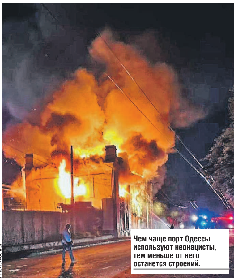
Чем чаще порт Одессы используют неонацисты, тем меньше от него останется строений.

- Мы видим, как в моменте подлета дроны собираются в стаи на большой высоте, их