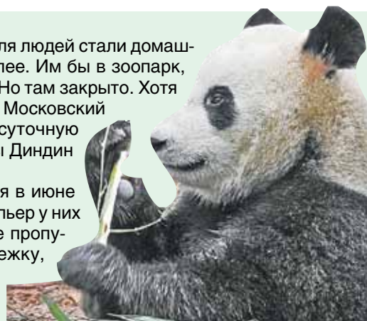
Кто это - Жуи или Диндин? Через неделю просмотра научитесь их отличать с первого взгляда.

❖ ГДЕ СМОТРЕТЬ: moscowzoo.ru/about-zoo/live-stream/