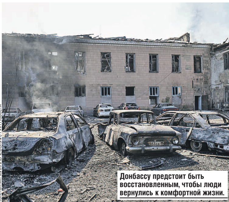
Донбассу предстоит быть восстановленным, чтобы люди вернулись к комфортной жизни.

решили ее до конца даже во время Великой Отечественной войны. Европа - исчадие всех бед человечества, в том числе бед России. Это исчадие колониализма, расизма, самых худших идеологий, в том числе нацизма. Даже христианство в Европе приобрело иезуитские формы, вспомним сожжение тысяч и тысяч женщин на кострах. Слава богу, от этого отошли, но забыли и христианство. Но главное, конечно, - Европа была исчадием всех главных войн челове-