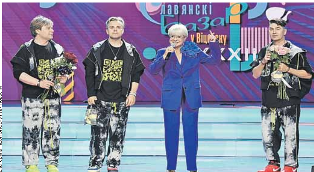
Броневицкая и «мальчики Алибасова», как и двадцать лет назад, заставили всех плясать.