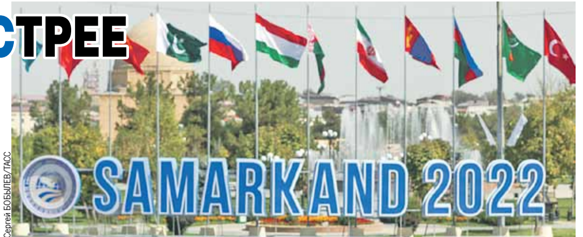
Форум в культурной жемчужине Узбекистана стал историческим.

Из желающих присоединиться к ШОС выстроилась очередь. Полноправным участником стал Иран, важнейший региональный игрок с мощной экономикой, кото-