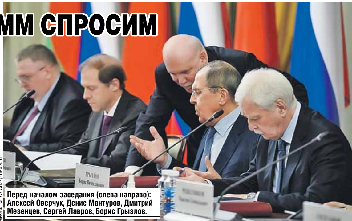
Перед началом заседания (слева направо): Алексей Оверчук, Денис Мантуров, Дмитрий Мезенцев, Сергей Лавров, Борис Грызлов.

- Одна из основных причин роста цен на товары, с чем мы все столкнулись, - выросшая стоимость перевозки из-за изменения прежних схем